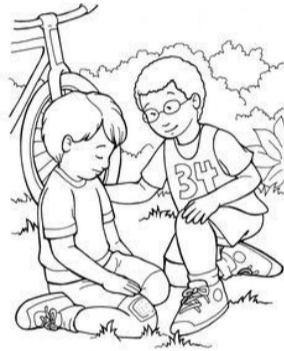
I can follow Jesus by helping others.